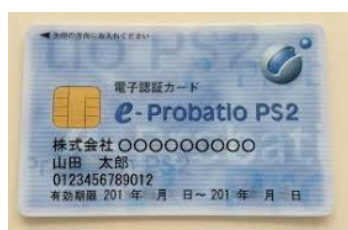
ICカード (例 : e-Probatio PS2)

※ICカードリーダー (読み取り機) も必要になります。 ICカードのご購入の際に、合わせてご購入ください。