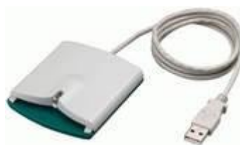
ICカードリーダー (読み取り機)