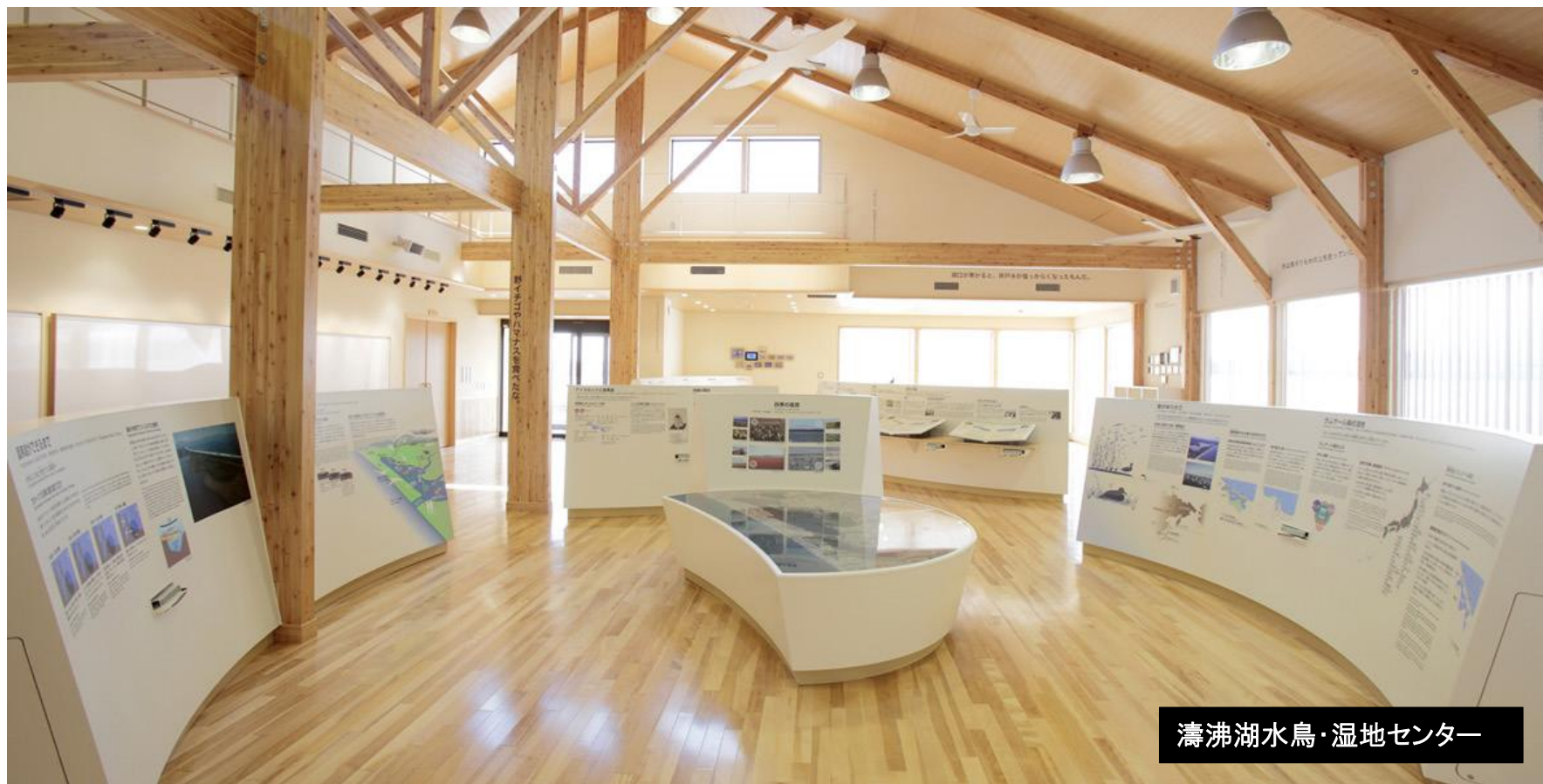
濤沸湖水鳥・湿地センター