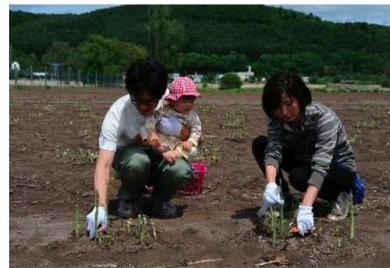
大曲湖畔園地収穫体験