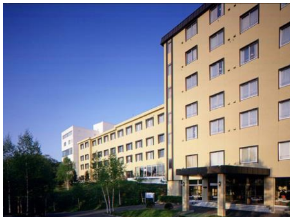
天都の宿 網走観光ホテル