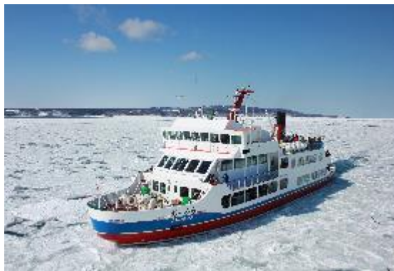
網走流水観光砕氷船おーろら