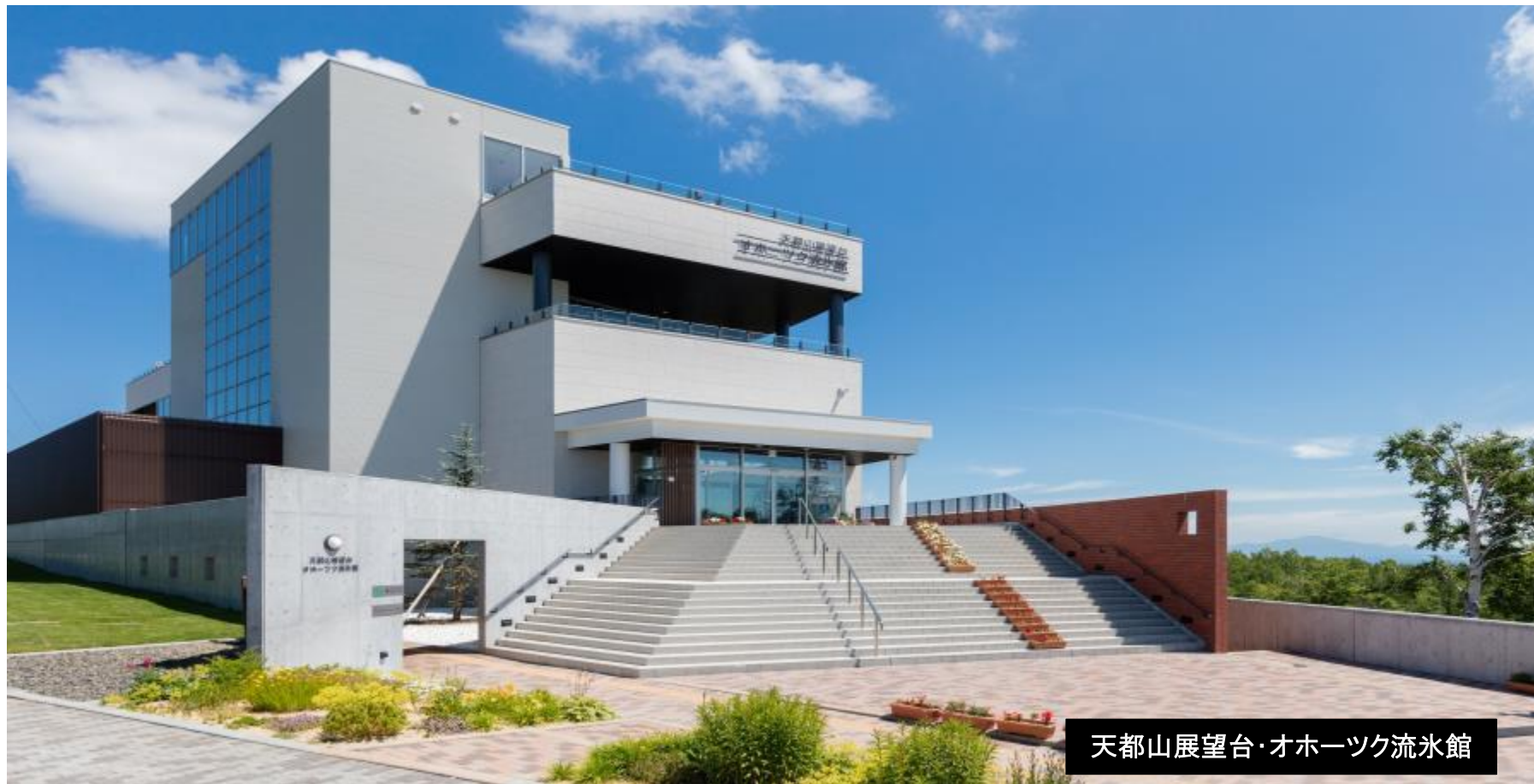
天都山展望台・オホーツク流水館