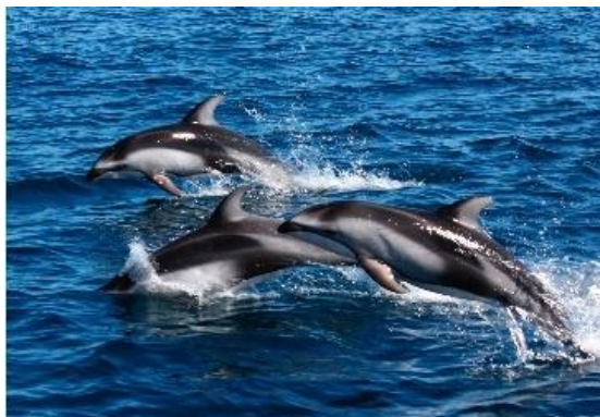
ネイチャークルーズ