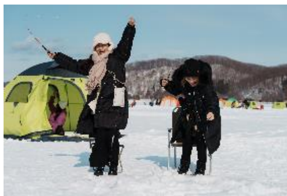
網走湖ワカサギ釣り