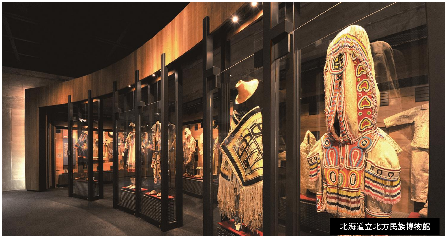
北海道立北方民族博物館