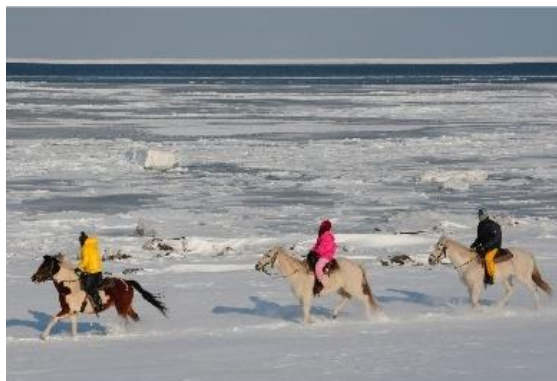
ホーストレッキング