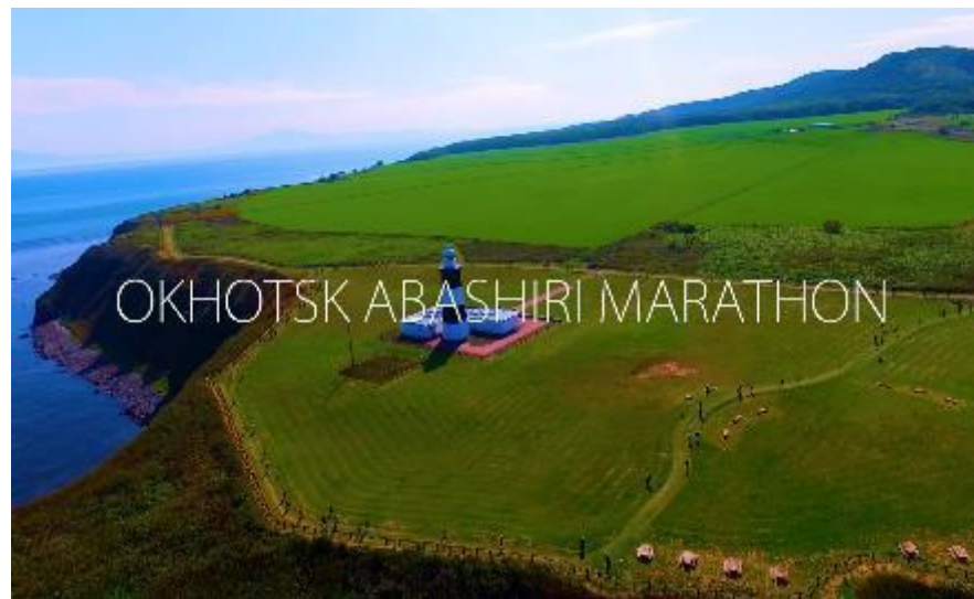
オホーツク網走マラソン