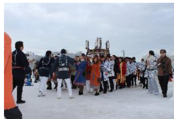
あばしりオホーツク流水まつり