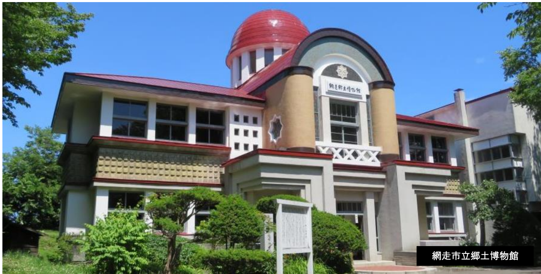
網走市立郷土博物館