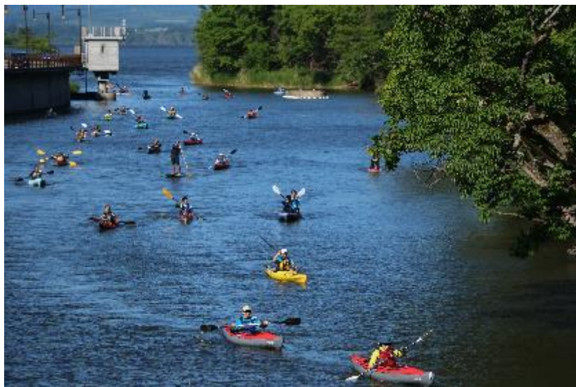
オホーツクSEA TO SUMMIT