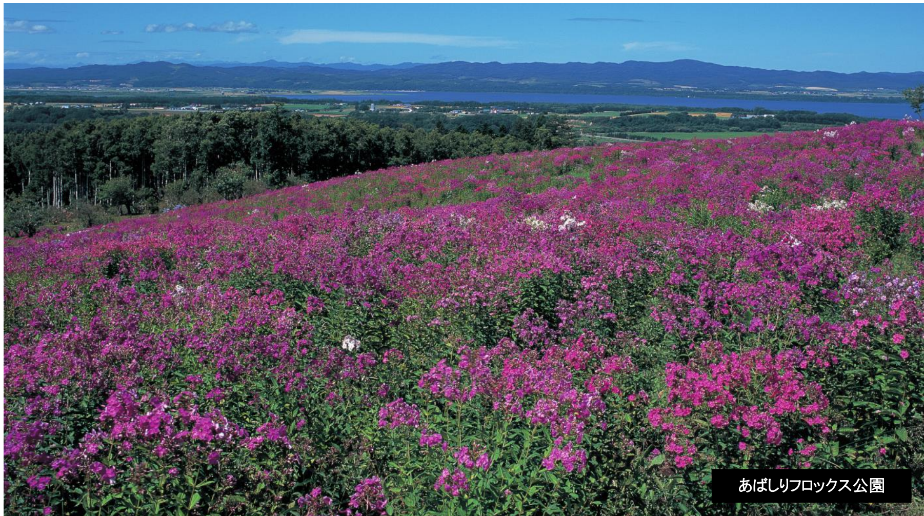
あばしりフロックス公園