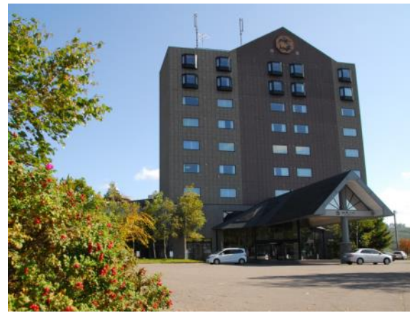
北天の丘 あばしり湖鶴雅リゾート