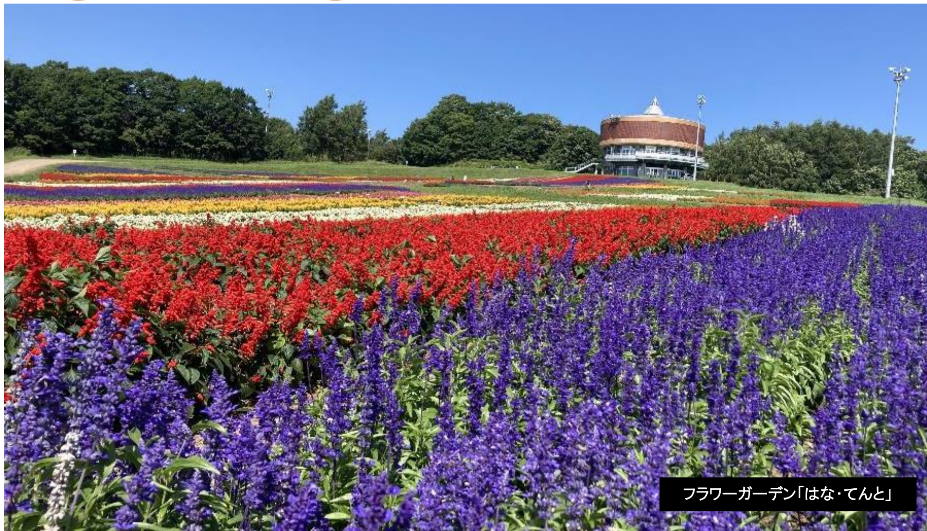
フラワーガーデン「はな・てんと」