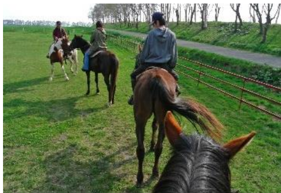
ホーストレッキング