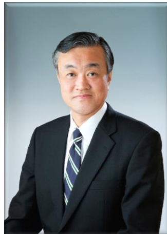
網走市長 水谷 洋一