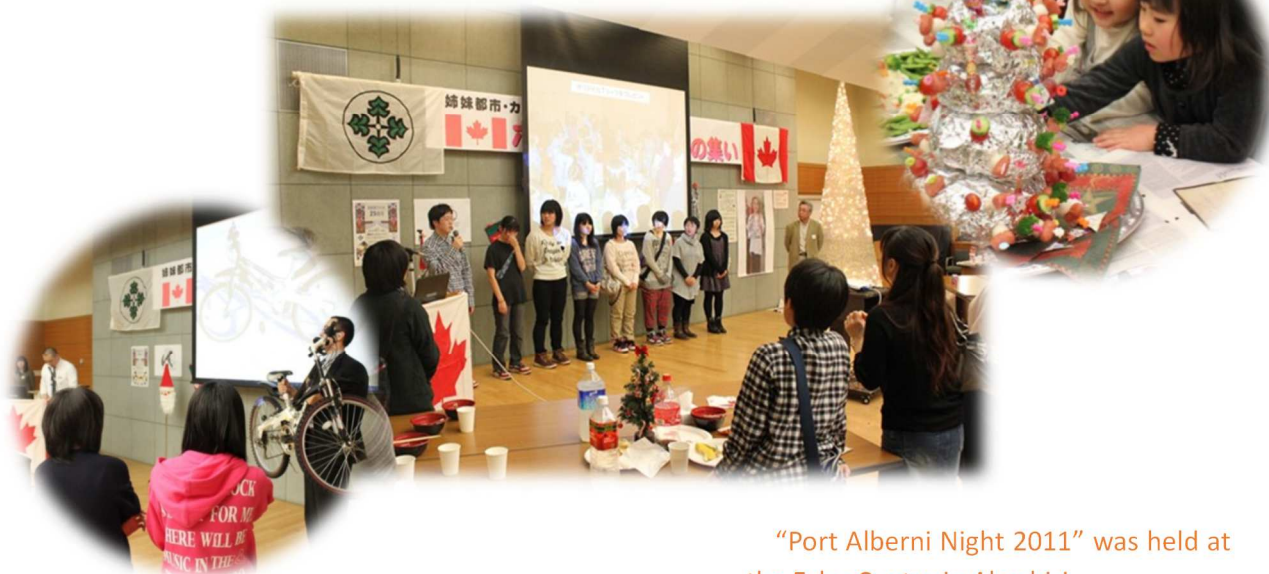
"Port Alberni Night 2011" was held at the Echo Centre in Abashiri.