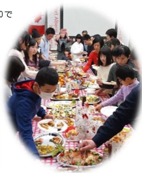
"Port Alberni Night 2019" was held at the Echo Centre in Abashiri.