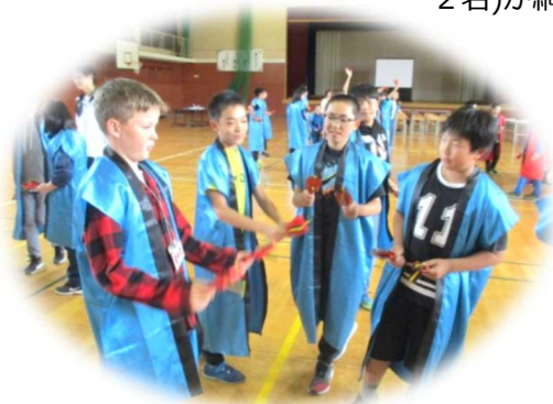
The eleventh student delegation from Port Alberni, a group of 4 students and 2 adults visited Abashiri.

ポートアルバーニ市から第11回教育交流訪問団（生徒4名、大人2名）が網走市を訪問しました。