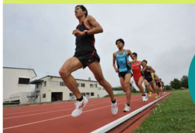
日本陸連三種公認コース