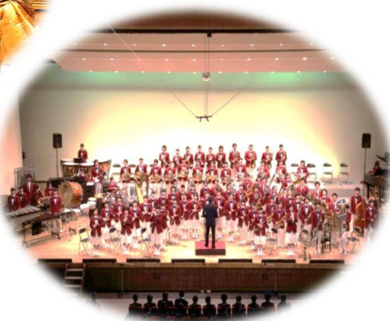
北海道内高校吹奏楽部と市内中学校吹奏楽部 による合同練習・ジョイントコンサート