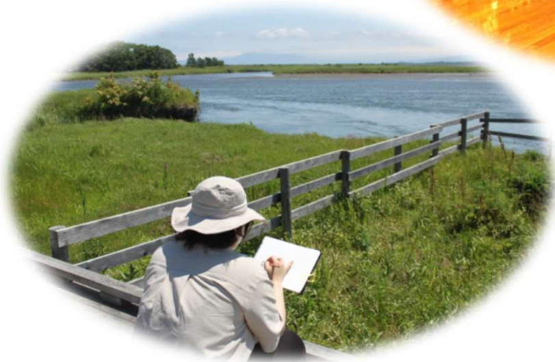
網走市内での写生合宿