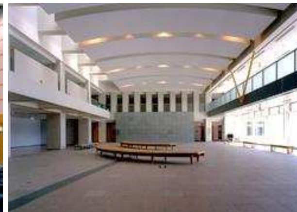
アトリウムロビー