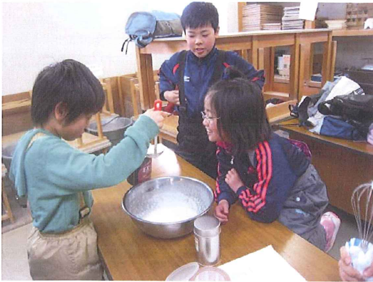
アイスクリーム作り