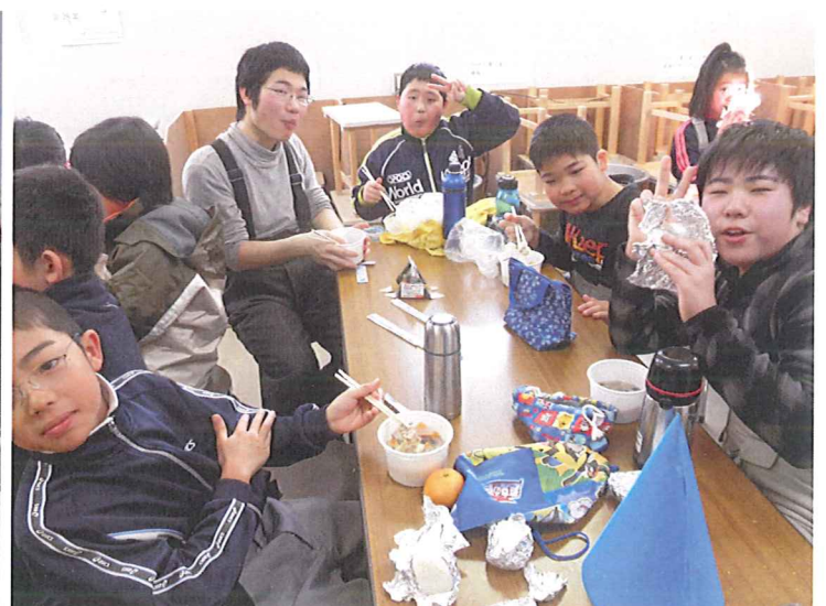
お昼ごはんはおにぎりと豚汁でした！