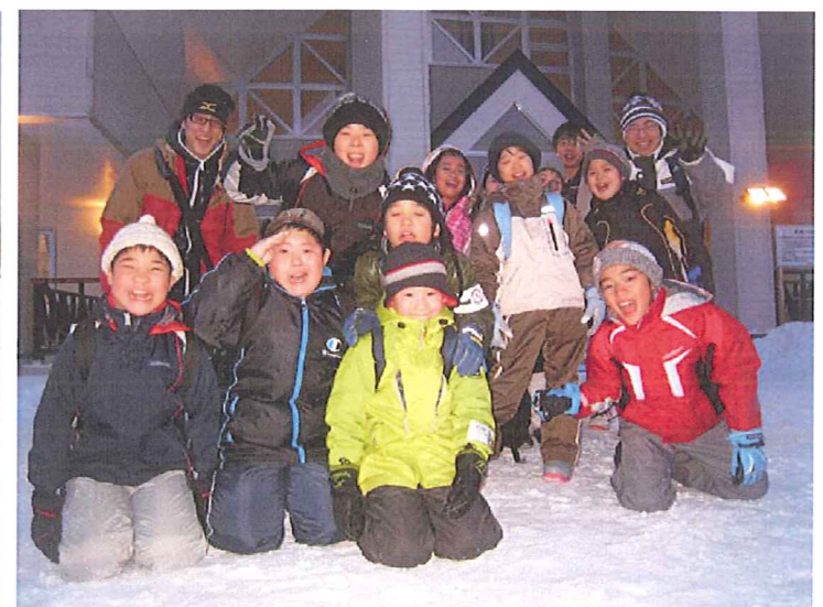
帰りは、もう日が落ちていました。 1日楽しかったね！