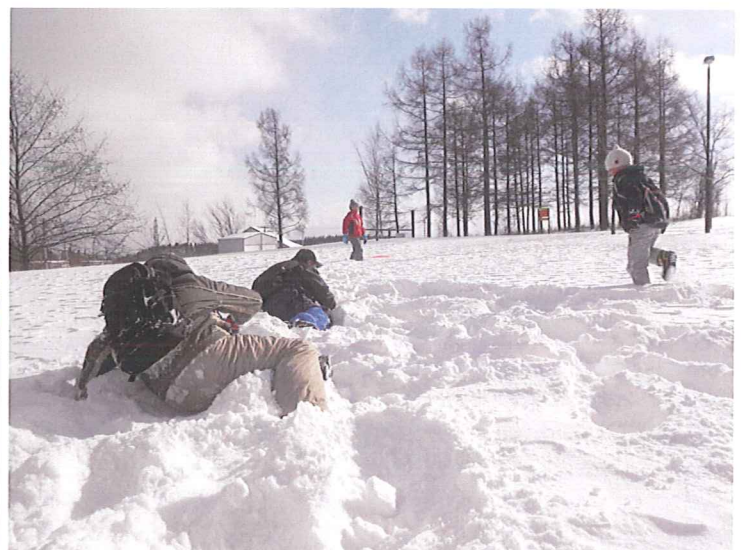
この日は最高気温-6℃の極寒。 でも元気いっぱいです！