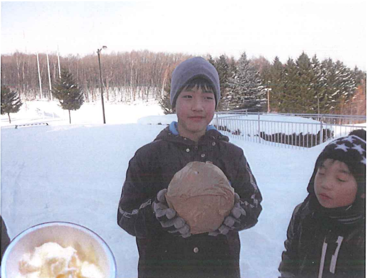
ボール型にして蹴り、 アイスクリームができあがりました！ まるでハーオンダッツ！？