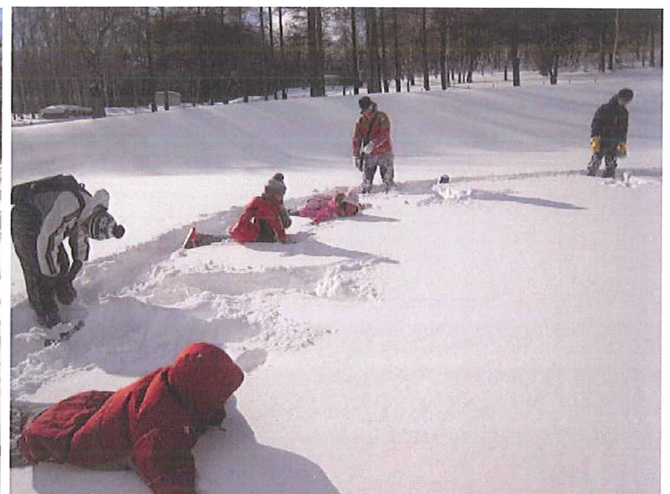
人型つけ。あおむけになった時は、 青空がとてもキレイでした！