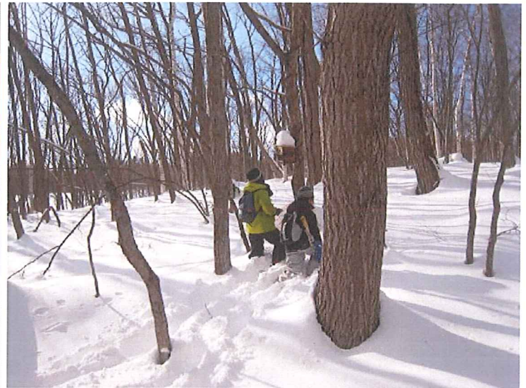
現代的なかんじき（スノーシュー）を 装着し、出発！