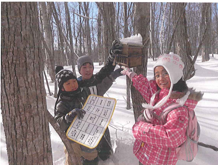
「冬の天都山BINGO」をしながら 冬の森をたんけん！