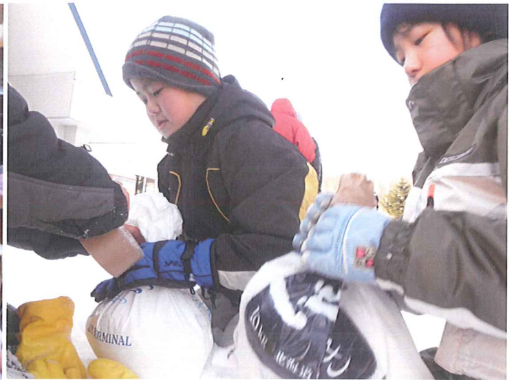
塩と雪を混ぜ寒剤を作ります。