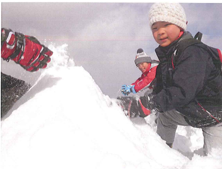
雪積み、穴掘り大会開催！