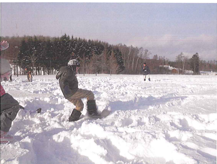
初めてのキックゴルフ、 ホールインワンが記録されました！