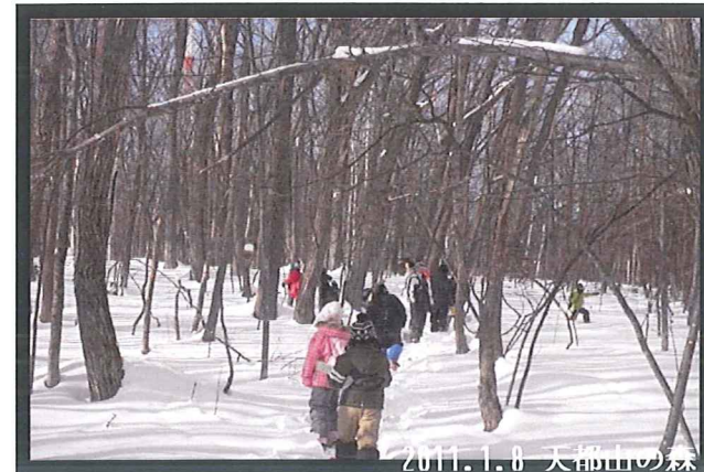
2011. 1. 8 天都山の森

1月はファンコースのシマカ・ロセト・カムイコース、そして「冬限定アート！雪像・氷像作り」の講座がありました。少しだけご紹介いたします。講座の内容については、網走市HPにも掲載しています。網走市HP→目的から探す→教育・文化の社会教育→講座・教室のご案内→あばしり学