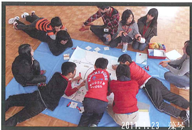
1/22-23 ロセトコースの「冬の宿泊」

みんなで何をしているかという…実は「10年後の網走」を考えて、1枚の大きな紙にまとめているところです。海上には飛行場や色んな施設、まちなかには路面電車もありました。ロセトコースの参加者は10年後、20～22才になっています。どんな大人になっているのでしょうか？