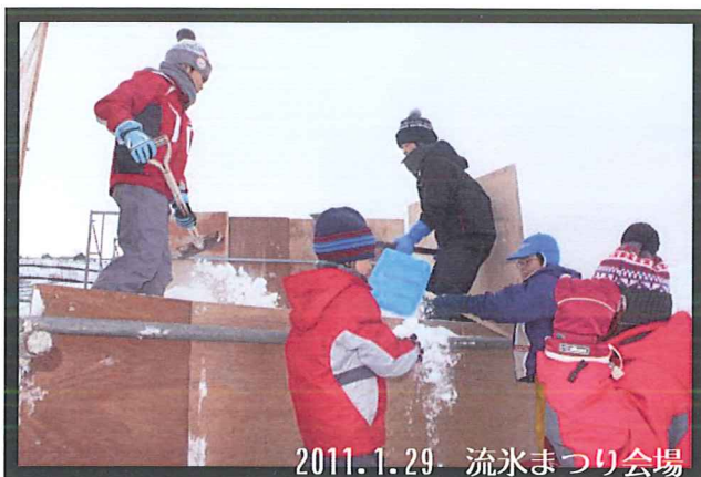
1/29 「冬限定アート！雪像づくり」講座

この日は計画です。氷像作りはみんな初めて。タイトルは「淡水魚」。金魚とエンジェルフィッシュを作ることになりました。