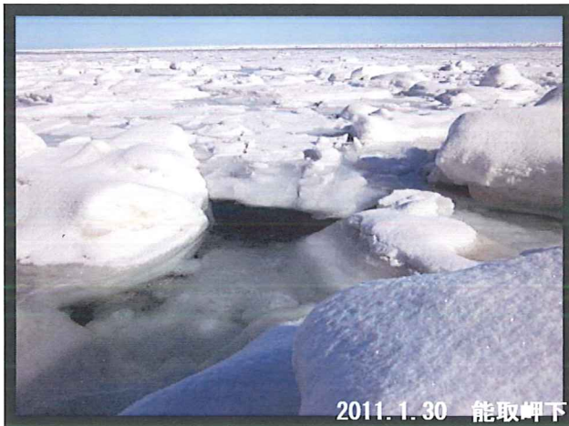
2011. 1. 30 能取岬下

下の写真は能取岬の下から撮影した流氷です。お休みを利用して何とか流氷に近づきたい！と思い、あばしり学カムイコースの仲間と少しだけ遠征してきました。近くまで行くと、流氷の合間からのぞく海水がエメラルド色でとても澄んでいることに気づかされます。