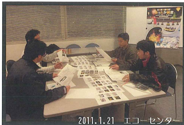
1/21 「冬限定アート！氷像づくり」講座

カマイコースでは1年間、「網走をもっと知りたい」をテーマに、網走の色々なところへ出かけ、網走の色々なことを調べてきました。メンバーで話し合った結果、その軌跡を冊子「知っとこ網走」にまとめ、閉講式で披露いたします。