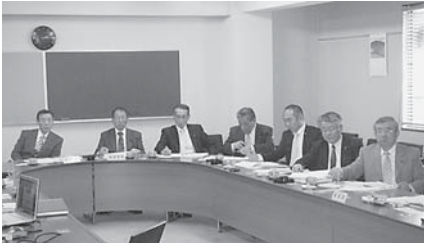
大和郡山市を視察

以上三点について調査致しましたが、早速今議会の一般質問に活かされるなど、今後の委員会活動を通して市の政策向上に役立つものと確信しています。