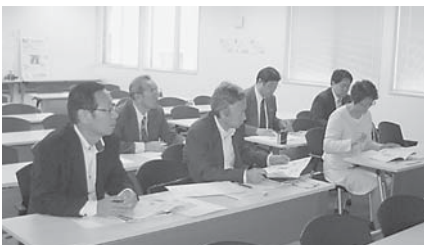
堺市「リマテック株」を視察

千葉県八千代市の市民参加型廃棄物処理基本計画は、当市で行っている手法と大差なく、他市に誇れる行政運営が証明されたと言えます。